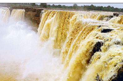
पर्यटकों की पहली पसंद मैनपाट के साथ चित्रकोट

पर्यटन विभाग को अपने टूरिस्ट पैलेस के मोटल तथा रिसॉर्ट से जो आमदनी क्रिसमस तथा नए साल में हो रही है। उसमें 40 प्रतिशत से ज्यादा आय चित्रकोट से हो रही है। दिसंबर में पर्यटन विभाग को आने वाले टूरिस्टों से एक करोड़ 30 लाख रुपए की बुकिंग हुई है। पिछले वर्ष की तुलना में इस साल दिसंबर में कमाई का आंकड़ा जस्ट्र कम हुआ है।